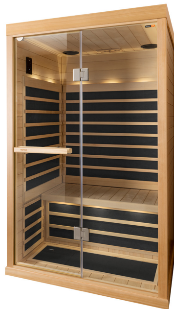
Cabine Infra T-820 Black